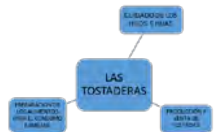
Figura 2. Las mujeres y la alternancia del trabajo doméstico y el trabajo para el mercado.

Para las mujeres campesinas el comercio de las tostadas ha favorecido el surgimiento de nuevas relaciones comerciales con las mujeres de Comitán o de San Cristóbal y se han creado fuentes de ganancia adicional para las comerciantes-intermediarias de la ciudad a través del trabajo de las productoras de los poblados rurales.