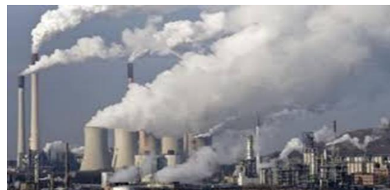
Fotografía No. 1 Contaminación del Aire